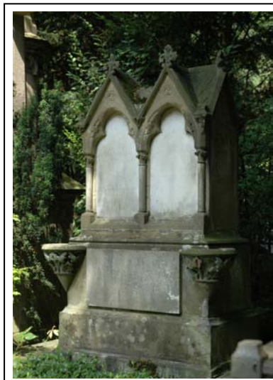
Flur 19 Grabmal Pelzer